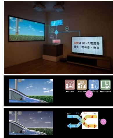
▲(上)未来型スマートハイム体感 ▲(中)新生活様式の解説 ▲(下)冬の換気方法について ※画像はイメージです

セキスイハイムのスマートハウス「スマートハイム」で実現可能な HEMS や IoT 技術を活用した暮らしの利便性、将来の拡張性について、一日の暮らしを再現する寸劇風プレゼンテーションでお伝えします。また、新しい生活様式へ配慮した暮らしへの対応力を高めた換気・空調システムの実演など、日常生活の安全を守る住設備についても体感していただけます。