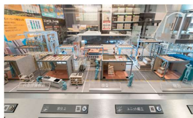
▲可動型工場ジオラマ

セキスイハイムの工場生産の全貌を再現したジオラマと共に、家づくりの各工程を解説します。タブレット端末のカメラ機能を用いてQRコード ※2 を読み込むことで、ジオラマと連動した実際の工場内建築シーンの映像をご覧いただけます。