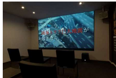
▲自然災害発生シミュレーションシアター ※イメージ

東北地方の自然災害発生シミュレーション動画などで構成された映像と大音響に加え、4D技術 ※1 （「振動」「フラッシュ演出」「風の体感」）により臨場感をもって体感していただきながら、減災住宅の重要性・必要性を解説します。