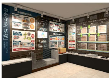
▲ハイムスタディギャラリー ※イメージ

「ハイムスタディギャラリー」においては、北東北エリアの「雪」について解説します。積雪量が多く、屋根に積もる雪が重い北東北において、家づくりの際に必ず考えておきたいことが「雪」です。雪の重さが家に与える影響や、雪を考慮した敷地の有効利用など、北東北ならではの雪に強い住まいのポイントを学んでいただけます。また、近年多発する地震をはじめとする自然災害など、身のまわりでいつ起きるか分からない脅威への備えとして重要な点や注意すべき点を解説し、北東北に住むうえでの安全・安心についてご理解いただけます。