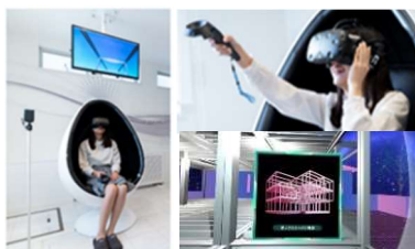
▲ハイムユニットVR ※イメージ

ヘッドマウント型の360°VR体感装置を導入し、建物の仕組みや構造、建築工程を体験できます。映像は、仮想空間バーチャルファクトリー内で、家づくり博士の「ドクターハイム」が登場するコンテンツです。アトラクション感覚で家づくりをご体感いただけます。