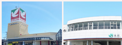
ヨークベニマル いわき泉店 約400m(徒歩5分)