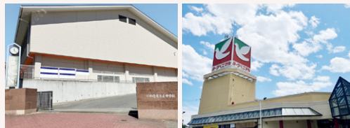
いわき市立泉中学校 約1910~1930m(徒歩24~25分)