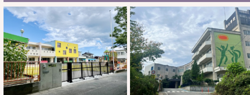
泉幼稚園 約470~490m(徒歩6~7分)