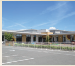
盛岡ひまわり保育園