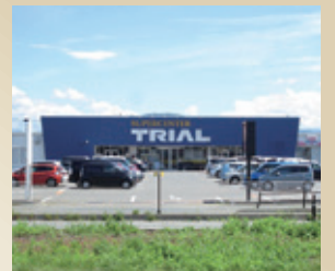
メガセンタートライアル 盛岡西バイパス店