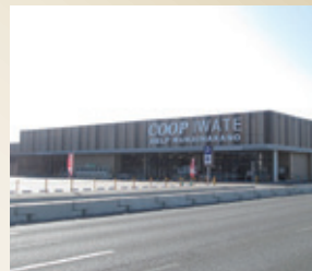
いわて生協 ベルフ向中野