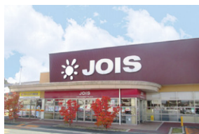
ジョイス三関店 約920~1,010m