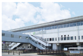
JR「一ノ関」駅(東口) 約1,700~1,790m(徒歩22~23分)