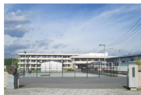
桜町中学校 約80~170m(徒歩1~3分)