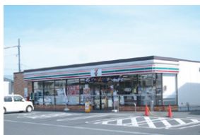
セブンイレブン一関樋渡店 約650~740m