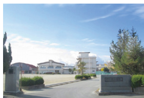
一関小学校 約780~870m(徒歩10~11分)